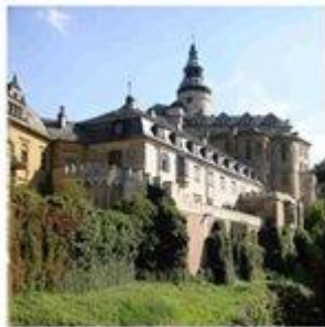
Hrad a zámek Frydant