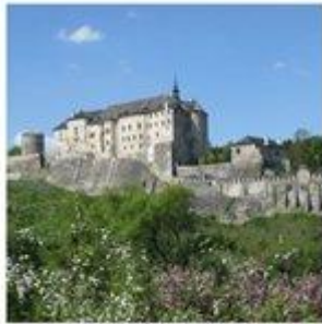
Hrad Český Sternberk