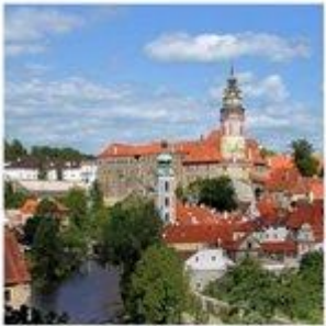
Státní hrad a zámek Český Krumlov