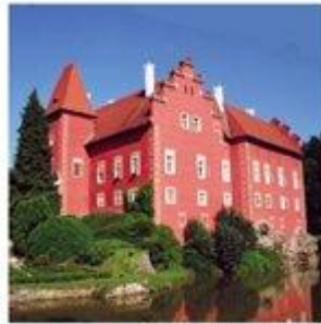
Zámek Červená Lhota