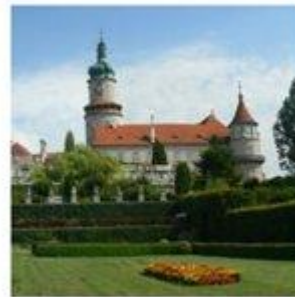
Zámek Nové město nad Metují