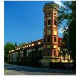
Zámek Heřmanův Městec