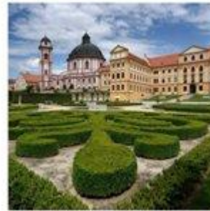
Zámek Jaroměřice nad Rokytvou