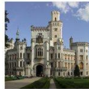
Zámek Hluboká nad Vltavou