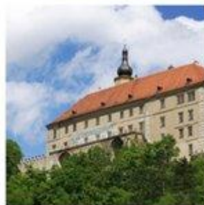
Zámek Náměšť nad Oslavou