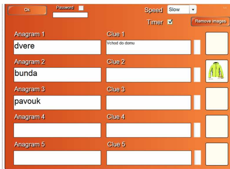
Obr. 2.: První pracovní stana s náhledem použitých slov

Ukázka z nefyzikálního prostředí. Na prvním anagramu si žáci vyzkouší jak aktivita funguje.