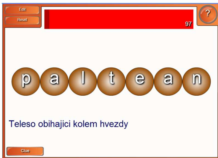
Obr. 1.: Ukázka spuštěné hry

Anagram: úkolem soutěžícího je správně přerovnat písmena tak, aby vzniklo slovo z oblasti fyziky. Clue zde zobrazuje slovní nápovědu.