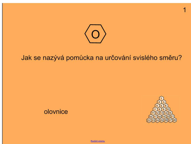
Strana s otázkou s odkrytou odpovědí

obdélník s otazníkem se zobrazí správná odpověď na danou otázku. Kliknutím na malé hrací pole se vrátíme na stránku s hracím plánem.