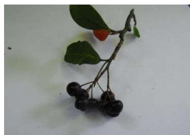
aronie-černý jeřáb (plody - šťáva)

c) léčivky zvyšující obranyschopnost organismu