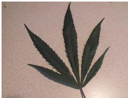
technické konopí (list, nať)