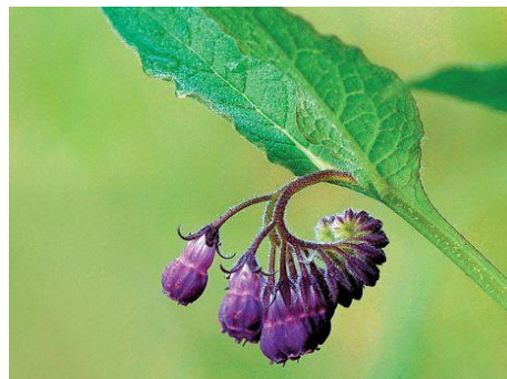
kostival lékařský (kořen)

Z technického konopí i z kostivalu se vyrábí mast .