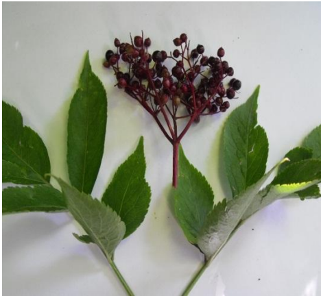
bez černý (list)